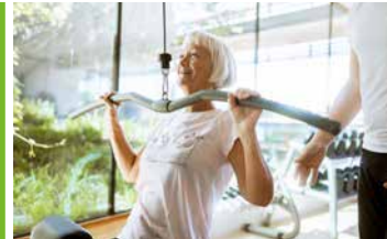
Kraftvoll und Fit *