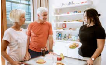
Gesunde Ernährung *

Seniorinnen- und Seniorengesundheitsprogramme für 60- bis 69-Jährige in Pension oder Ruhegenussbezieherinnen und -bezieher (zweiwöchiger Aufenthalt)