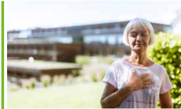
Mentale Fitness *

Seniorinnen- und Seniorengesundheitsprogramm für ab 70-Jährige (zweiwöchiger Aufenthalt)