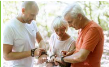
Ausdauernd und Aktiv *