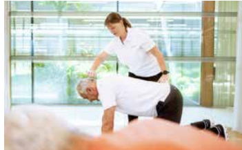
Gesunder Rücken *