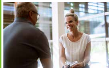
Rauchfrei in 20 Tagen

Aufenthalte zur Nikotinentwöhnung (20-tägiger Aufenthalt)