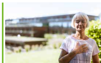
Mentale Fitness *

Seniorinnen- und Seniorengesundheitsprogramm für ab 70-Jährige (zweiwöchiger Aufenthalt)