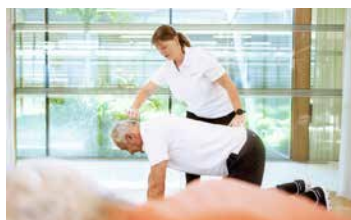
Gesunder Rücken *