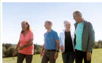
Altern mit Zukunft *

Seniorinnen- und Seniorengesundheitsprogramm für ab 70-Jährige (zweiwöchiger Aufenthalt)