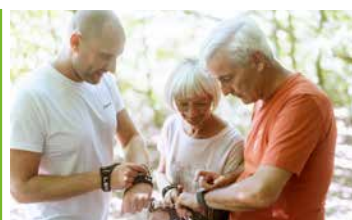
Ausdauernd und Aktiv *