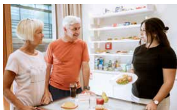
Gesunde Ernährung *

Seniorinnen- und Seniorengesundheitsprogramme für 60- bis 69-Jährige in Pension oder Ruhegenussbezieherinnen und -bezieher (zweiwöchiger Aufenthalt)