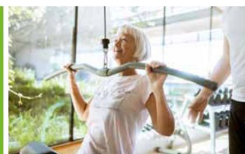
Kraftvoll und Fit *