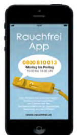
Bilder: Rauchfrei Telefon