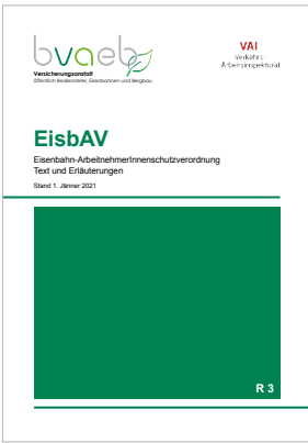
Eisenbahn-ArbeitnehmerInnenschutzverordnung (EisbAV) – Text und Erläuterungen