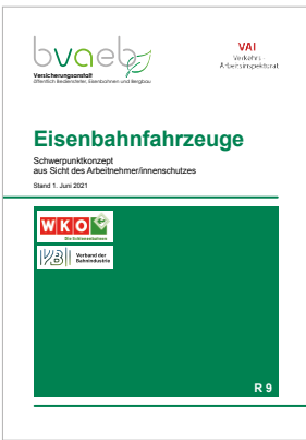
Schwerpunkt-konzept über die wichtigsten Arbeitnehmer/innenschutzbestimmungen für Eisenbahnfahrzeuge