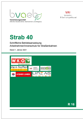
Schriftliche Betriebsanweisung Arbeitnehmer/innenschutz für Straßenbahnen