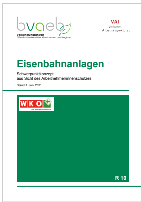
Schwerpunkt-konzept über die wichtigsten Arbeitnehmer/innenschutzbestimmungen für Eisenbahnanlagen