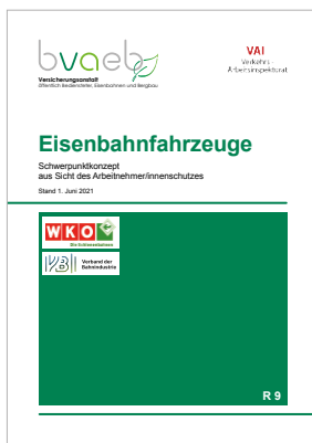
Schwerpunkt-konzept über die wichtigsten Arbeitnehmer/innenschutzbestimmungen für Eisenbahnfahrzeuge