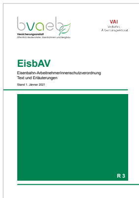
Eisenbahn-ArbeitnehmerInnenschutzverordnung (EisbAV) – Text und Erläuterungen