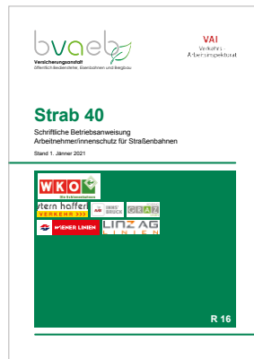
Schriftliche Betriebsanweisung Arbeitnehmer/innenschutz für Straßenbahnen