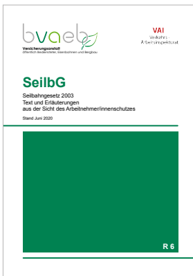
Seilbahngesetz (SeilbG) – Text und Erläuterungen aus der Sicht des Arbeitnehmer/innenschutzes