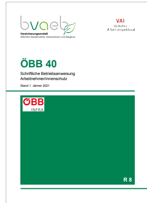
Schriftliche Betriebsanweisung Arbeitnehmer/innenschutz bei den Österreichischen Bundesbahnen (ÖBB 40)