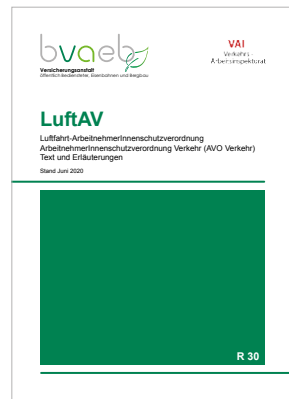
Luftfahrt-ArbeitnehmerInnenschutzVO AVO Verkehr – Text und Erläuterungen