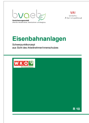
Schwerpunktkonzept über die wichtigsten Arbeitnehmer/innenschutz- bestimmungen für Eisenbahnanlagen