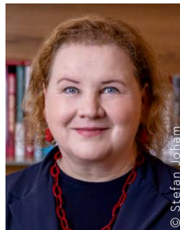
Bundesministerin Korinna Schumann

Ich danke allen, die täglich dazu beitragen, dass die österreichische Wiedereingliederungsteilzeit ein solches Erfolgsmodell sein kann. Sei es in der